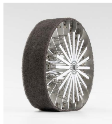
ตัวอย่างส่วนสัมผัสพื้นของยาง (Contact Patch)